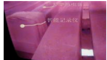
黑匣子在高温炉内