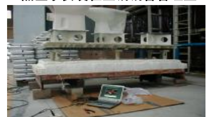
黑匣子安装在美标陶瓷隧道窑上