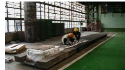
黑匣子安装在宝钢热轧钢坯上