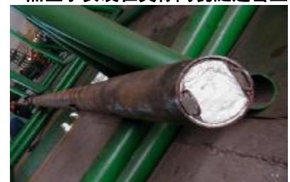
黑匣子安装在天津钢管上