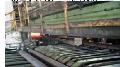
黑匣子安装在宝钢钢管管坯上